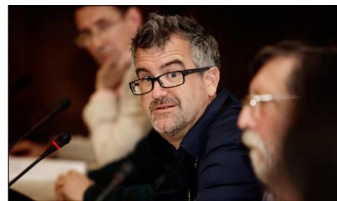
I Polen og Brasilien vil nye stadions stå halvtomme efter slutrunderne, vurderer Ian Nuttall.